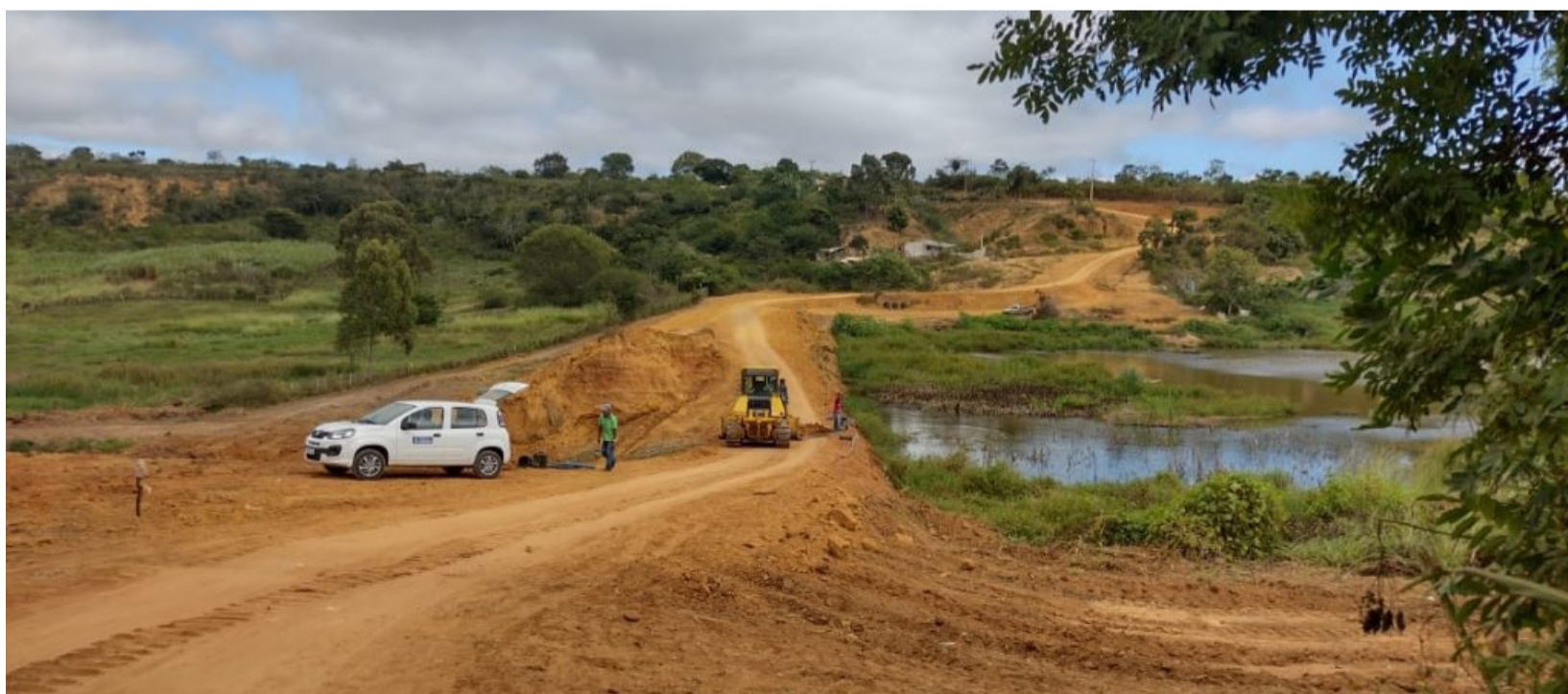
A ação de manutenção de estradas e reservatórios de água é constante.