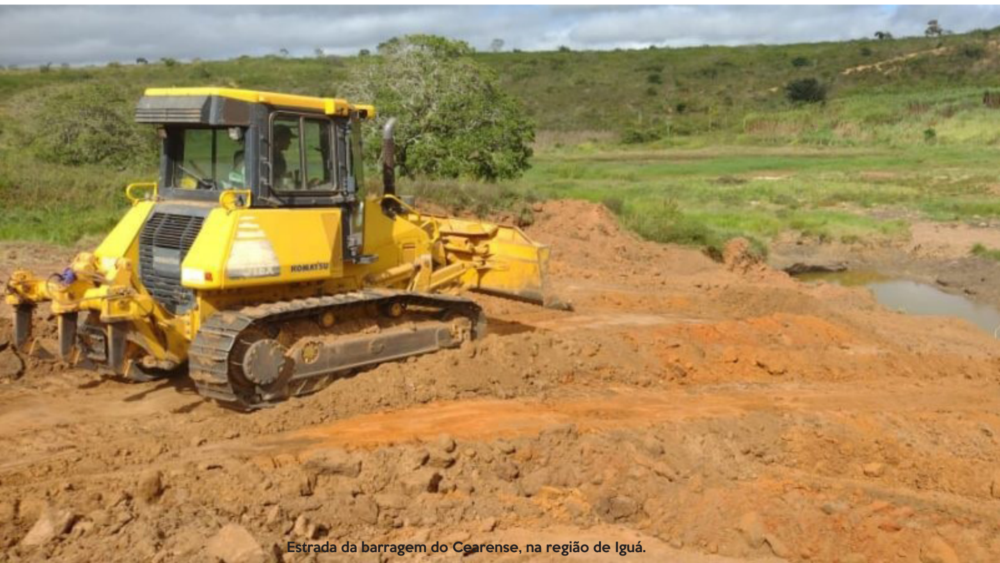
Estrada da barragem do Cearense, na região de Iguá.

A previsão é de que 25 quilômetros de estradas sejam recuperados pelo interior do município ao longo desses dias. O serviço está sendo realizado em Tapera e Bandinha, na região de Cabeceira da Jiboia; nos Quatis do Fumaça, nas proximidades da Barragem do Cearense, no Distrito de Iguá; e nos Povoados da Volta Grande e São Domingos, região da Estiva.