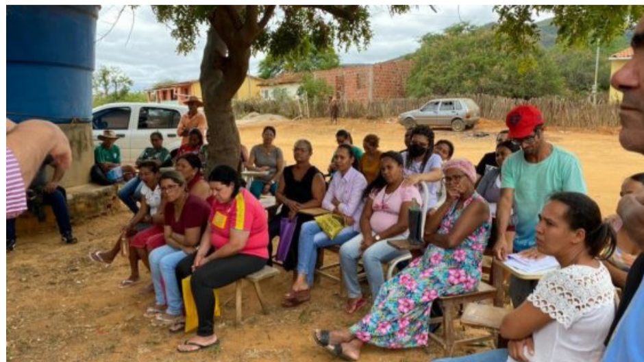
Para agricultores atendidos do Centro de Convivência e Desenvolvimento Agroecológico do Sudoeste da Bahia.

Os profissionais também estão articulando assistência técnica para os agricultores, com o objetivo de melhorar sua produtividade. No dia 9, as orientações foram levadas ao Povoado de Barreiro, Distrito de Cercadinho. A atividade ainda será realizada na Fazenda do Programa Palmas para Conquista, em Quatis dos Fernandes, na quinta (11); na Horta Comunitária do Bairro Kadija, sexta-feira (12); na Fazenda Experimental de Pedra Mole, no Distrito de Bate-Pé, onde é desenvolvido o Programa do Umbu Gigante também na sexta; e no Assentamento Goiabeira, sábado (13).