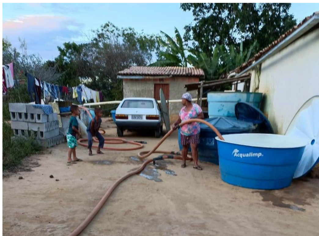
Família beneficiada com abastecimento de carro-pipa esta semana.

Até sexta-feira, mais 400 mil litros de água devem chegar à zona rural, atendendo a mais 150 famílias. O serviço ainda será realizado em cerca de 40 Povoados, nas regiões de Inhobim, José Gonçalves, Iguá e Bate Pé.