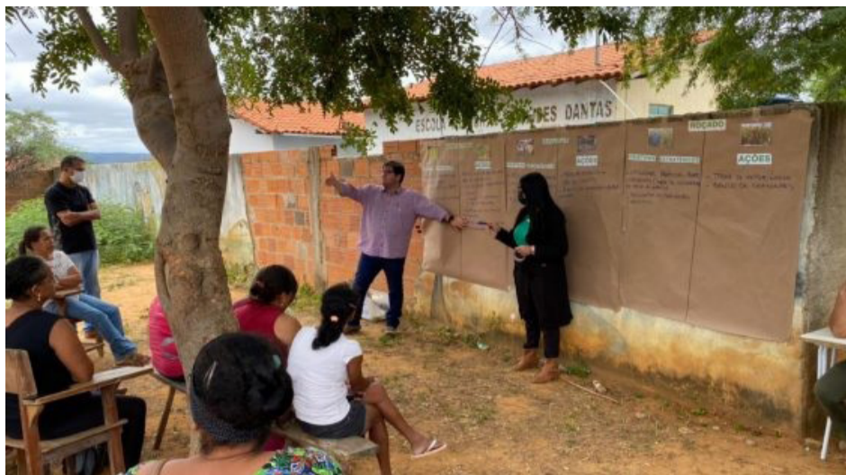
Apresentação do projeto Vamos Produzir, em Olho d'Água da Serra.