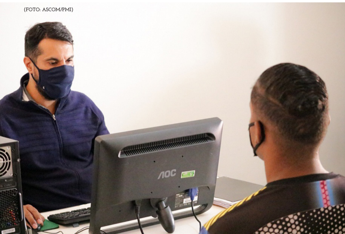
Treinados por técnicos do Instituto Nacional de Seguridade Social, servidores da Secretaria Municipal de Assistência Social já estão prestando serviços à população igaporaense, através do Inss Digital.

Além disso, será realizada a preparação e instrução de Requerimentos para posterior análise do Inss, a quem incumbe reconhecer ou não o direito à percepção de benefícios.