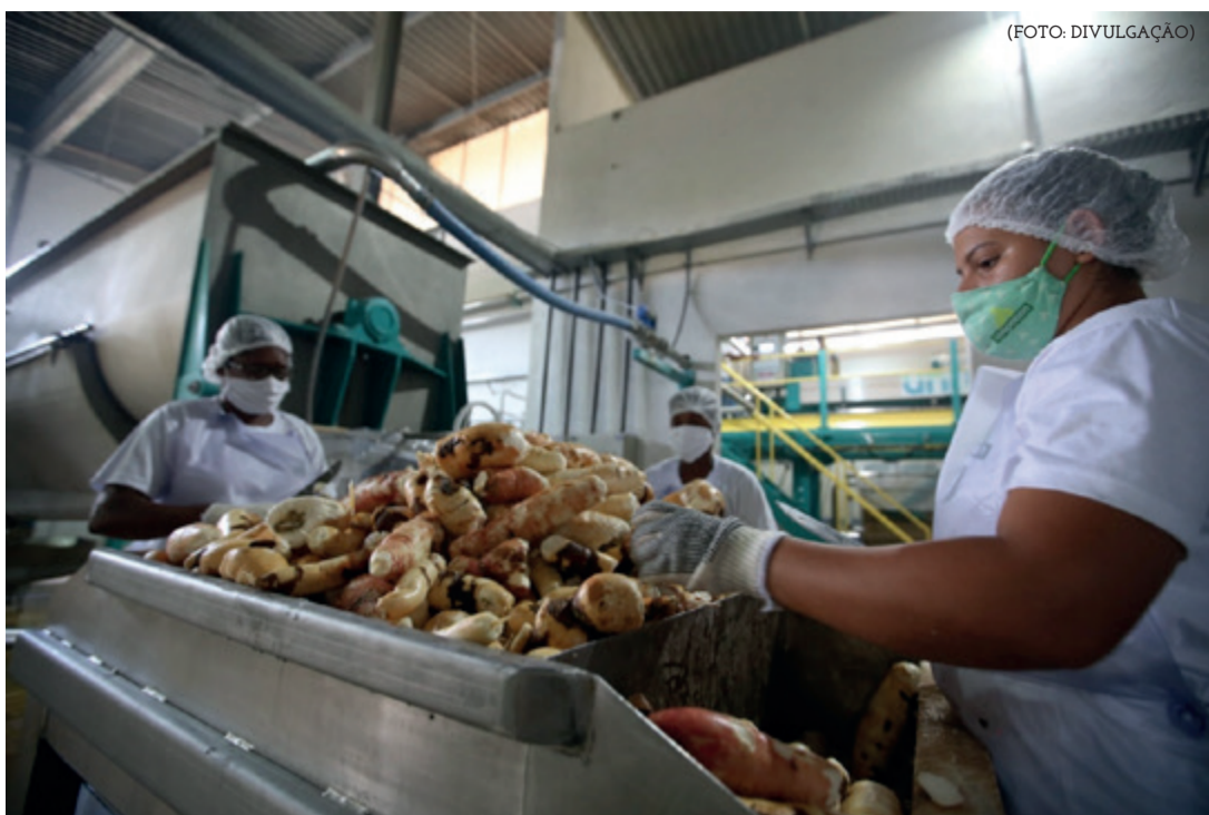
Mandiocultura - Cooperativa dos Produtores Rurais de Presidente Tancredo Neves - Coopatan

Nos últimos oito anos foram aplicados um total de US$ 260 milhões em investimentos, alcançando mais de 170.205 mil beneficiários, distribuídos em 342 municípios de todos os Territórios de Identidade da Bahia.