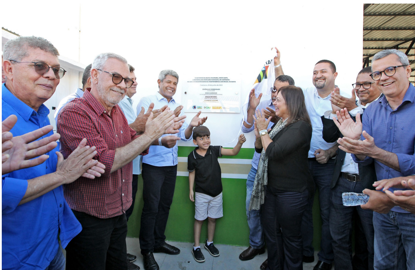
Governador Jerônimo Rodrigues descerrou a placa inaugurando as obras de requalificação do mercado Municipal.

Após a entrega do Complexo de Segurança Pública, Jerônimo Rodrigues Souza (PT) inaugurou as obras de reforma do Mercado Municipal, que incluíram a requalificação dos boxes e sanitários, construção de uma nova cobertura, além de novas instalações elétricas e hidráulicas. Repaginado, o Mercado Municipal vai continuar sendo, como pontuou o prefeito Paulo Alves Reis (PCdoB), importante ferramenta de fomento da Agricultura Familiar, assegurando melhores condições de trabalho para os comerciantes e produtos de qualidade para os consumidores, além de ser um ponto de encontro das pessoas.