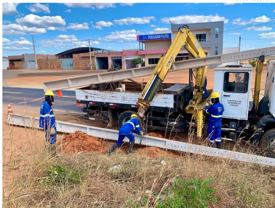
Implantação do novo Sistema de Iluminação da Avenida Airton Senna, trecho urbano da BR-430, em Igaporã.