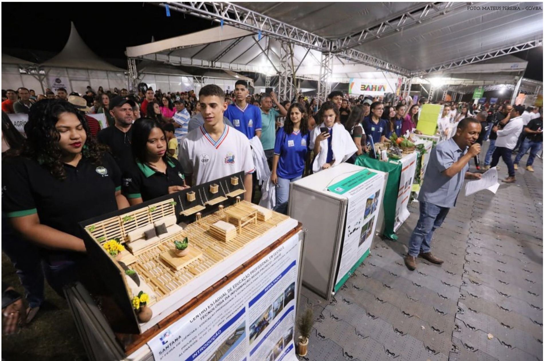
V Feira de Ciências e Educação Profissional e Tecnológica para o Desenvolvimento Integrado

A Secretaria de Estado da Educação da Bahia participa da realização da V Feira de Ciências e Educação Profissional e Tecnológica para o Desenvolvimento Integrado. O evento que promove a troca de experiências e expõe Projetos de Tecnologias Sociais da Educação Profissional e Tecnológica, envolve 16 stands com exposição de 61 Projetos de 38 Unidades Escolares, pertencentes a 37 municípios, que abrangem 21 Núcleos Territoriais de Educação e envolvem 266 estudantes e professores.