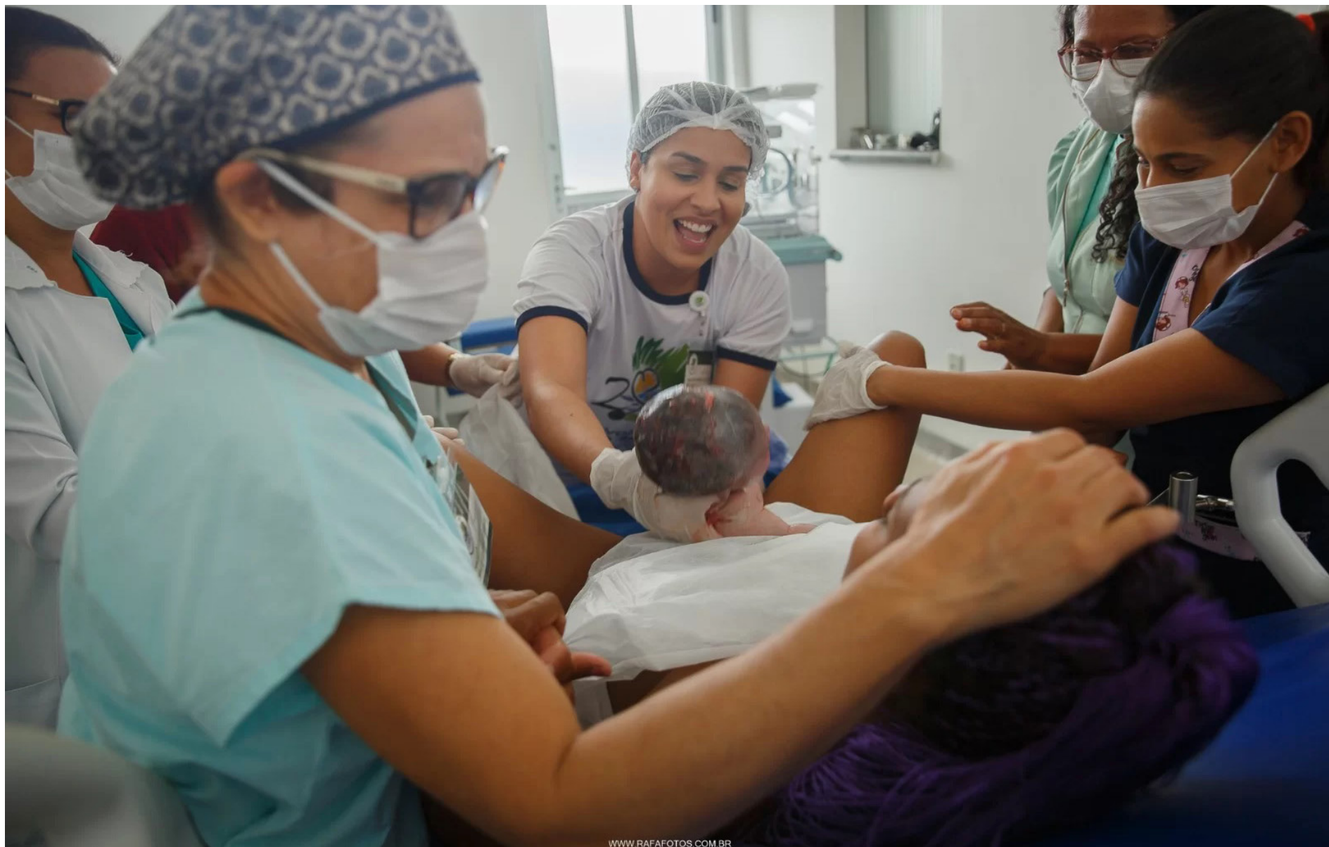
Momento marcante da 20ª edição do Voluntários do Sertão em Barra do Choça, o parto realizado pela Médica Ginecologista de Barretos, voluntária, assistida por estudantes de Medicina (voluntários) participantes da ação.

Além do atendimento médico e da realização de cirurgias, dentistas também reconstituíram sorrisos com Restaurações e Próteses Dentárias. Para facilitar os diagnósticos, foram realizados Exames de Ultrassonografia e Mamografias. Também foram entregues às pessoas atendidas medicamentos prescritos e kits de higiene pessoal higiene bucal.