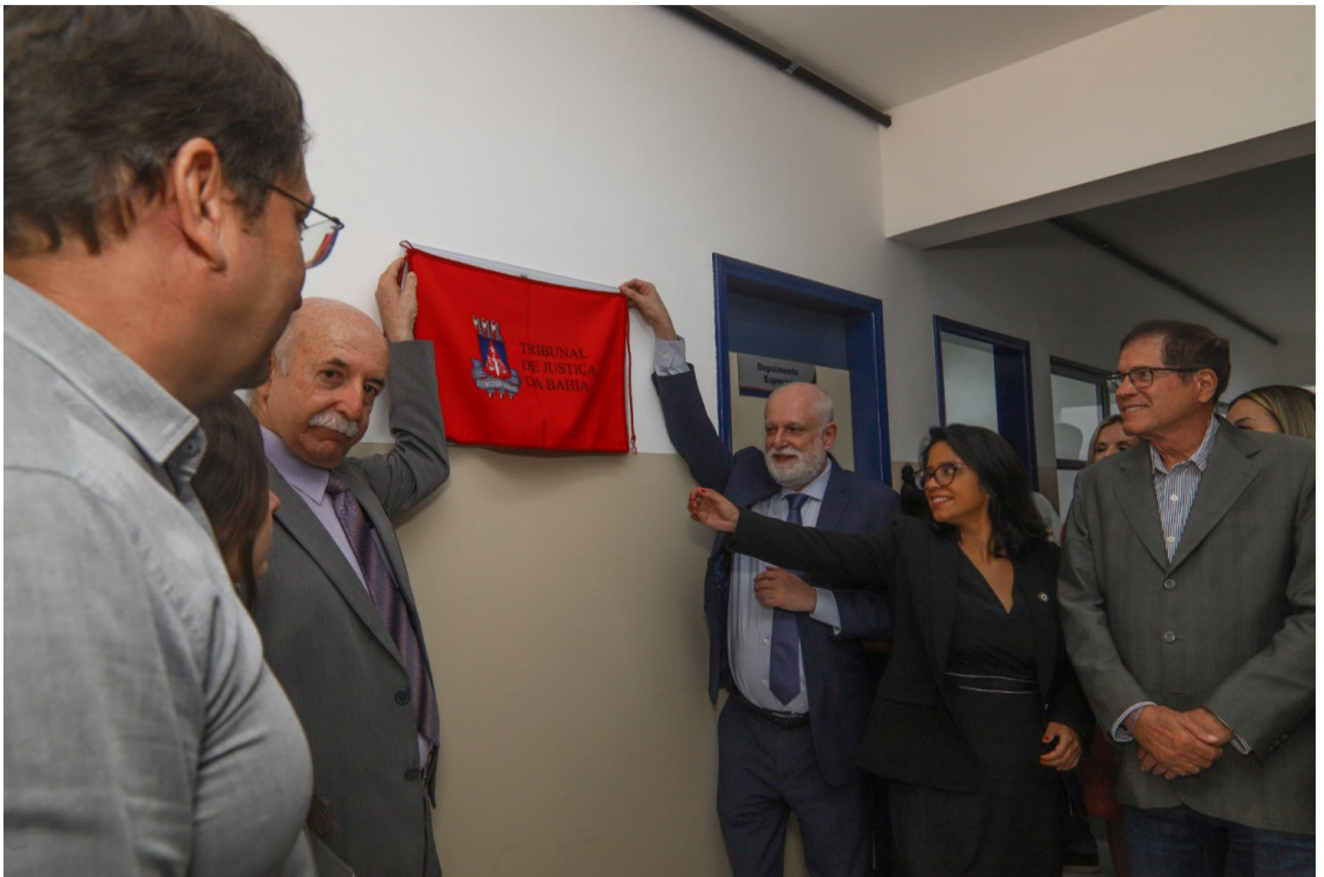
Presidente do TJBA, desembargador Salomão Resedá entre outras autoridades descerrando a placa de reinauguração do Fórum.